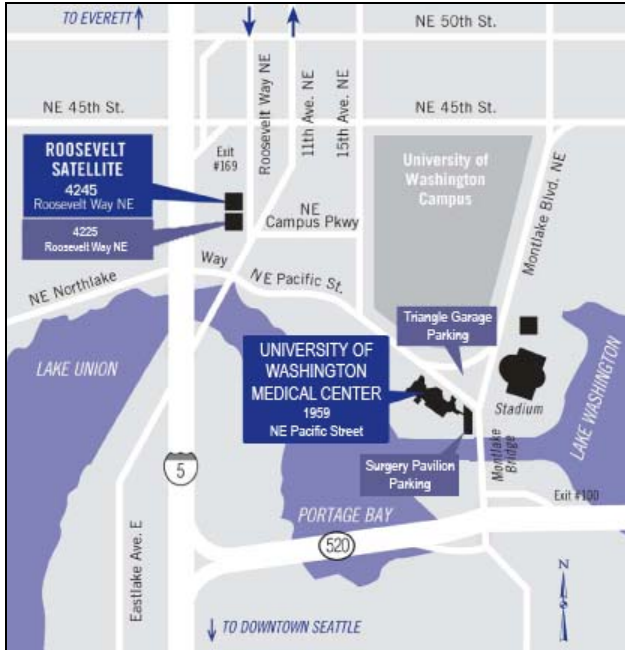
Карта района UWMC, поликлиник UWMC на ул. Рузвельта и их гаражей