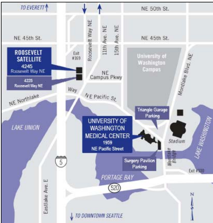
Area map showing UWMC, UWMC Roosevelt Clinics, and the Triangle and Surgery Pavilion parking garages