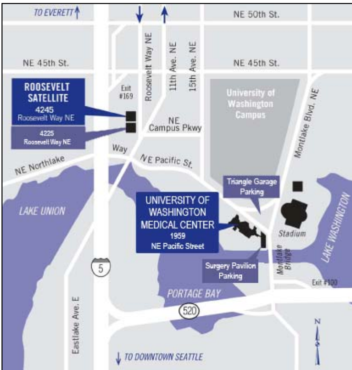
Area map showing UWMC, UWMC Roosevelt Clinics, and the Triangle and Surgery Pavilion parking garages