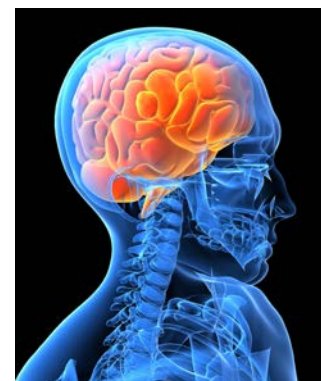
An EEG checks how your brain works by measuring your brain waves.