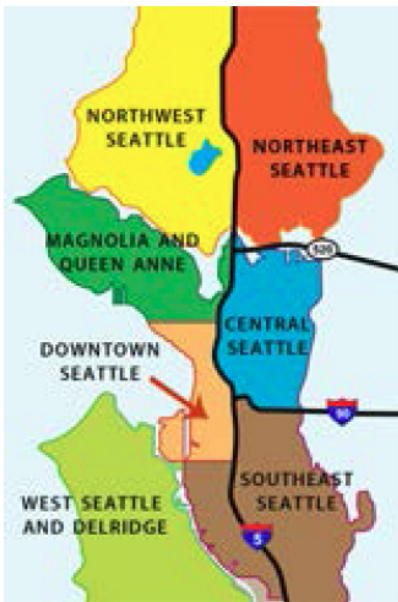
En el sitio web de la Autoridad de Vivienda de Seattle se proporciona información sobre diferentes barrios del centro de Seattle.