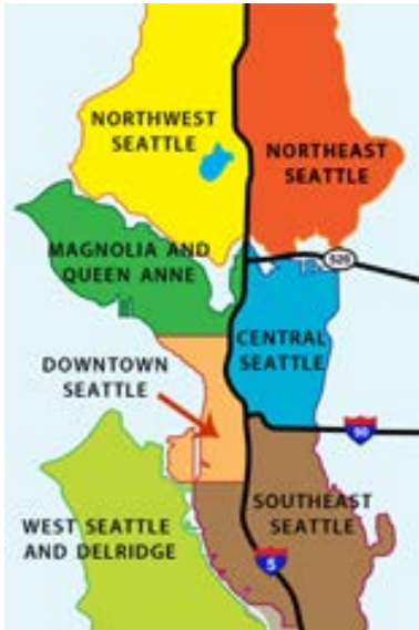
The Seattle Housing Authority website provides information about different neighborhoods in downtown Seattle.