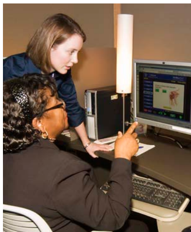
The Health Information Resource Center offers UWMC patients and families free use of computers.

magazines, phone cards, stamps, gifts, candy, snacks, and beverages. Weekday hours are from 6:30 a.m. to 9 p.m. Weekend hours are from 8:30 a.m. to 5 p.m.