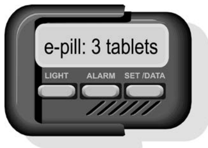
Figura 3: Un localizador