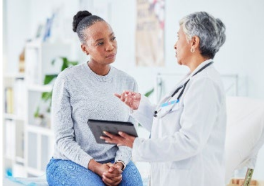
ስለ ምርመራዎ ማንኛቸውም ጥያቄዎች ወይም ስጋቶች ካሉዎት ከጤና እንክብካቤ አቅራቢዎ ጋር ይነጋገሩ።