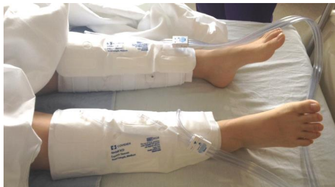
SCD는 다리의 혈액순환을 돕기 위해서 때때로 팽창합니다.