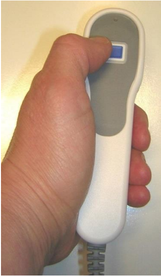
PCA로 투여받는 진통제의 양을 스스로 조절합니다.