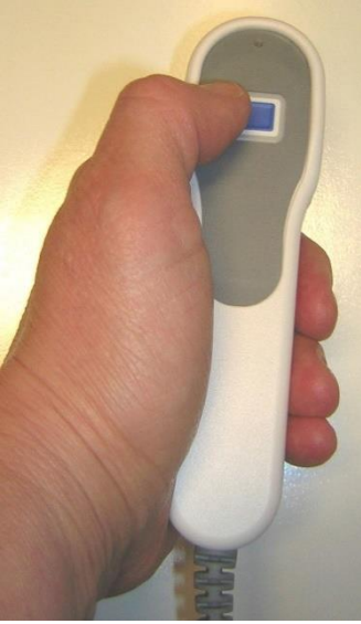
مع PCA ، يمكنك التحكم في كمية مسكنات الألم التي تتلقاها