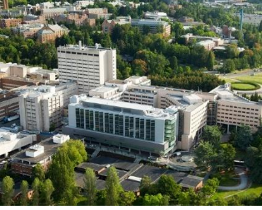
يقع UWMC - Montlake شرق الطريق السريع 5 وشمال 520.