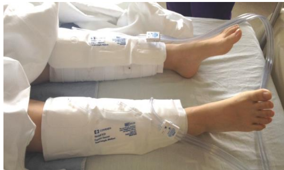
تنتفخ SCDs من وقت لآخر للمساعدة في سريان الدم في ساقيك .