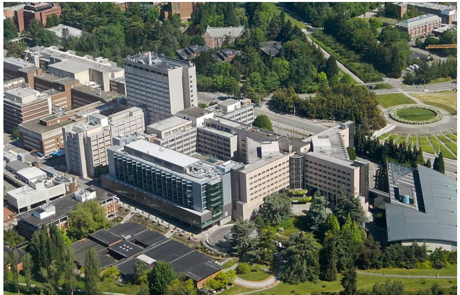
مركز UW الطبي - مونتليك في سياتل ، واشنطن