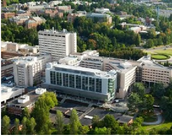
Bệnh Viện UWMC - Montlake ở phía đông Xa Lộ 5 và phía bắc Quốc Lộ 520.