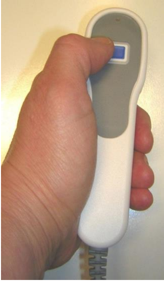
Dùng máy PCA, quý vị tự điều khiển lượng thuốc giảm đau.