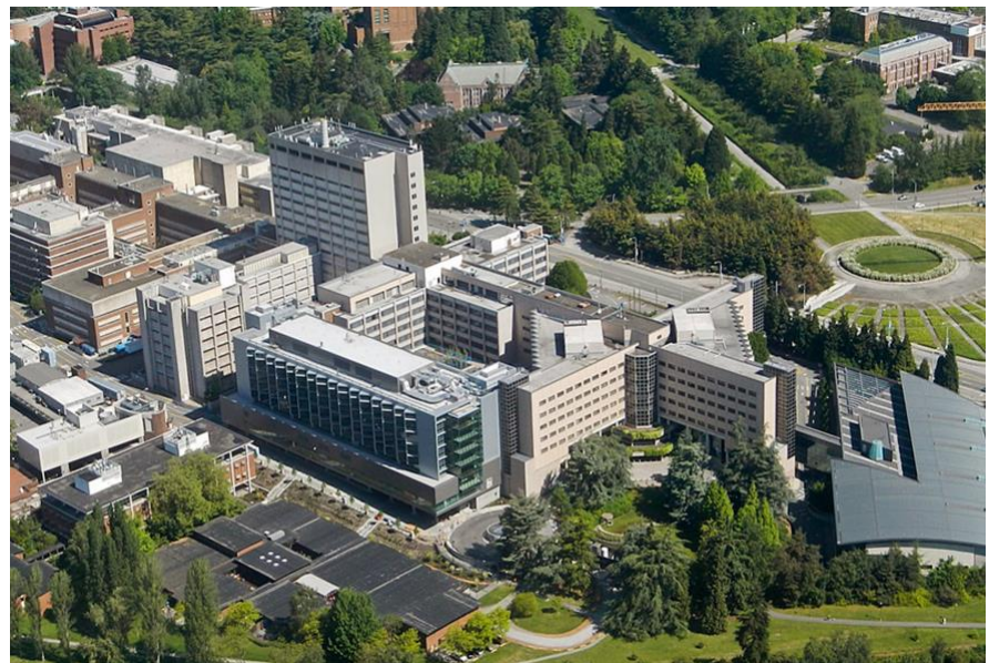
Bệnh Viện UW - Cơ sở Montlake tại Seattle, Washington