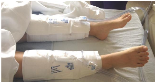
Dùng thiết bị đấm bóp tuần tự bọc bắp chân để giúp máu lưu thông.