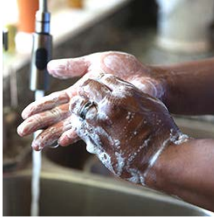
اغسل يديك كثيرًا بالماء والصابون لمدة 20 ثانية على الأقل.