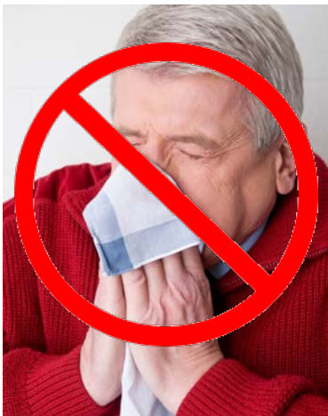
수술 이후 6 주일 동안 코를 풀지 마십시오.