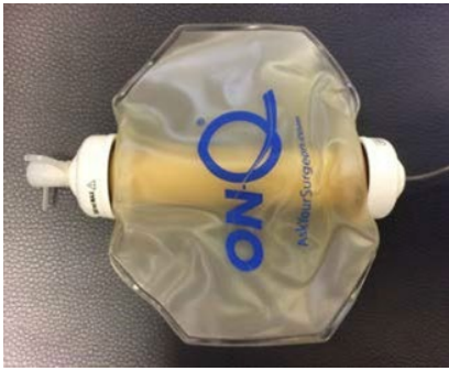
The pump when it is empty.

Image used with permission from Halyard Health.