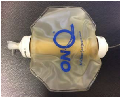
The pump when it is empty.

Scan this QR code with your phone to learn more and access helpful videos.