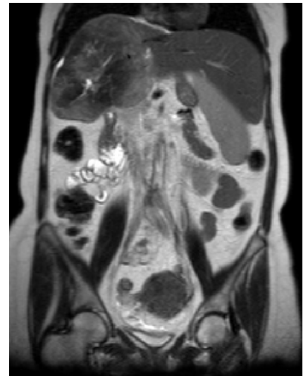
An MRI image of the abdomen.