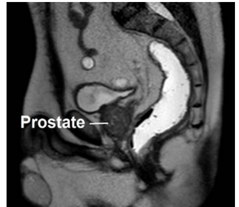
An MRI image of the prostate gland and the structures around

An MRI scan usually involves taking at least 2 sets of pictures. Each set lasts 2 to 15 minutes and shows a different area of your prostate gland and the structures around it.