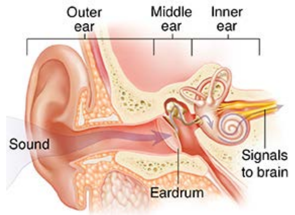
The eardrum is in the middle ear.

Most patients have very little pain after this procedure. You may take acetaminophen (Tylenol) or ibuprofen (Advil, Motrin), if needed.