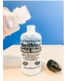
Pour 8 oz. water into the bottle