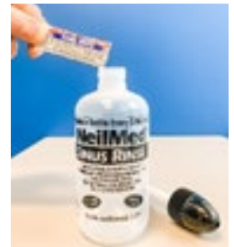
Add the packet or homemade mix