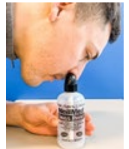
Rửa xoang mũi