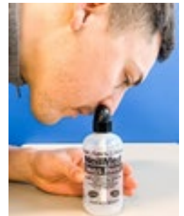
Do your sinus rinse