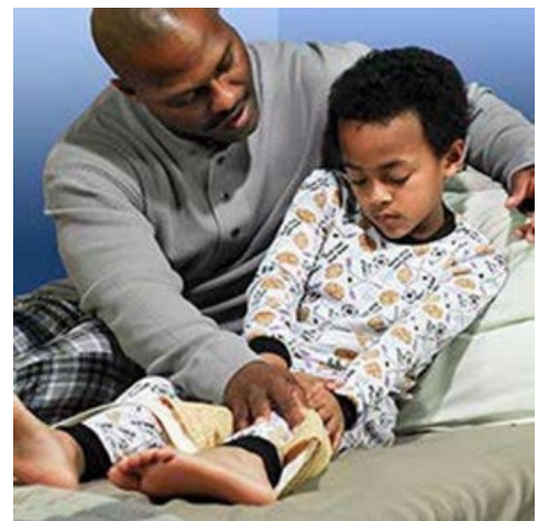
Talk with children in words that they can understand.

There are books for both parents and children you may find helpful when preparing to talk with young ones. Your social worker can suggest some titles.