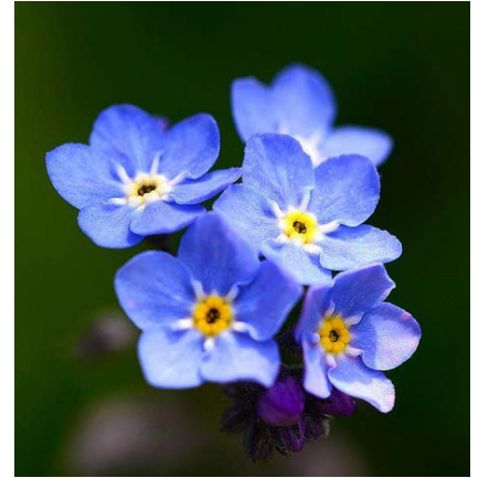
We are very sorry for your loss.

Families and friends of a patient who has died in the hospital have questions. They want to know what happens after the death, what hospital staff and family members need to do, and how to find the resources they need.