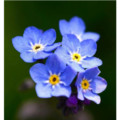
Lamentamos mucho su pérdida.

Los familiares y amigos del paciente fallecido pueden tener preguntas como: qué sucede después del fallecimiento, qué tienen que hacer ellos y el personal del hospital, y cómo obtener los recursos que puedan necesitar.